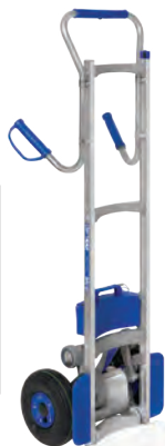
Prise repliable en L