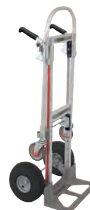
Gemini Jr. MA319